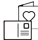
Cartes de voeux et cartes postales